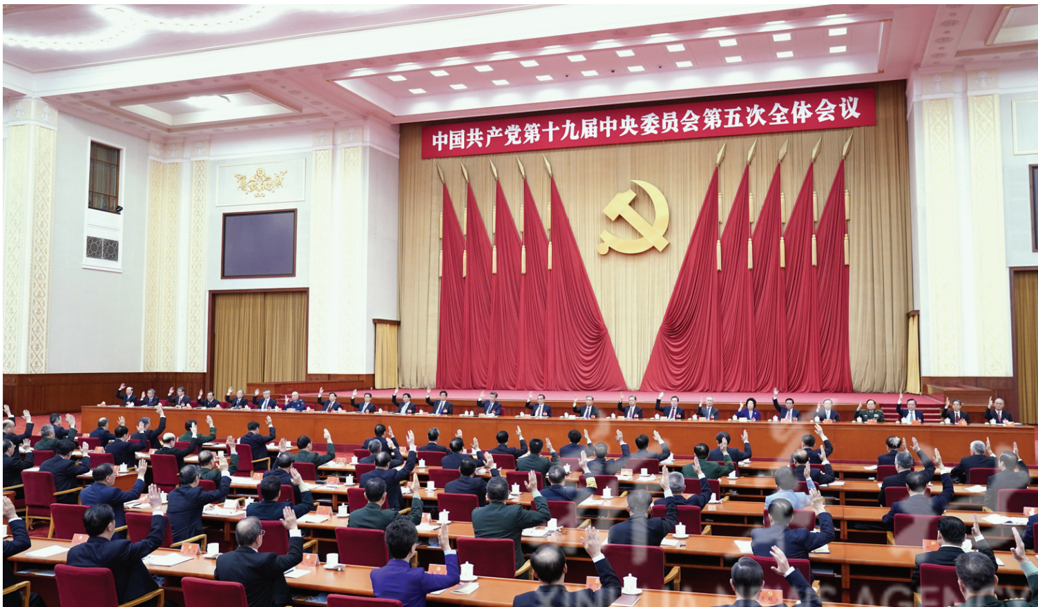
中国共产党第十九届中央委员会第五次全体会议,于2020年10月26日至29日在北京举行。中央政治局主持会议。