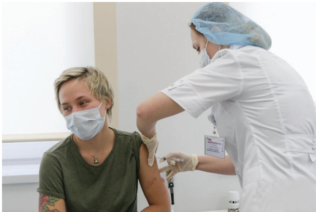
近日,在俄罗斯首都莫斯科,医护人员为申请者接种新冠疫苗。

游客体验国际航班观光游时需注意多项防疫措施,比如线上购票、登机时保持安全社交距离等。