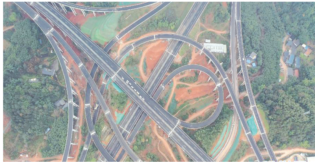
近日，四川省第一条直通小凉山彝区腹地的高速公路——仁沐新高速马边支线铺筑完成路面最后一公里，初步具备通车条件。图为仁沐新高速主线与马边支线相连的沐川枢纽互通。