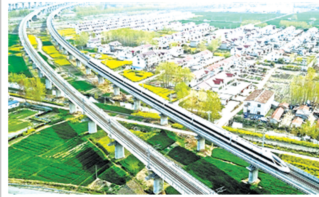
4月9日,一列动车组列车行驶在江苏连云港市海州区境内。4月10日零时起,全国铁路实行新的列车运行图。新图主动适应客货需求逐渐旺盛的实际,精准供给运输产品,大幅压缩部分城市间旅行时间,增开跨局大宗货物直达列车,扩充陆海新通道班列规模,提升客货运输服务品质。

要抓好贯彻落实工作,结合实际,制订工作方案。明确目标任务和推进措施,切实加强组织领导,强化渔业行政、执法、推广等管理服务机构、人员、经费保障,将渔业高质量发展工作作为实施乡村振兴战略的一项重要工作来抓,纳入本地经济和社会发展规划,纳入“菜篮子”市长负责制考核内容,确保各项任务落到实处。