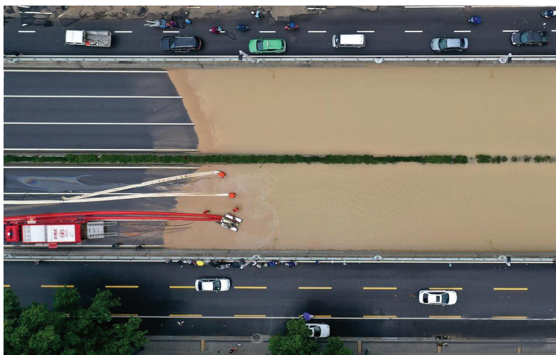
7月22日,来自江西的救援人员在郑州市京广南路隧道进行排涝作业(无人机照片)。近日,河南遭遇极端强降雨,郑州市区出现严重内涝。目前,各方救援力量正在紧张抢险救灾,保障人民群众生命财产安全。

此外,《意见》还从强化浦东新区国际开放门户枢纽功能方面出台支持举措,支持长三角世界级港口群建设,支持上海国际消费中心城市建设,促进消费品进口,助力浦东搭建“6+365”进博会展品变商品常年通道。