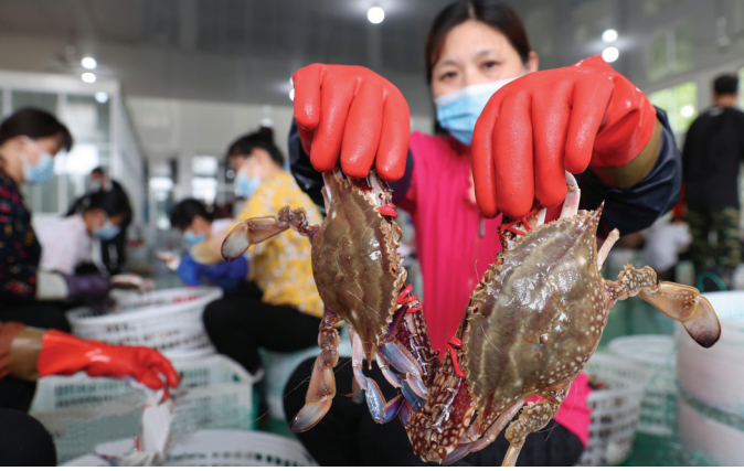
8月2日,江苏连云港市赣榆区首批驶往黄海渔场开捕的渔船陆续回港,满载而归。数万斤鲜活梭子蟹陆续上岸,当地渔民加紧进行分拣、整理、保鲜封装,及时装车外运,满足国内各大城市市场供应。

生命周期的十大服务功能。长三角资本市场服务基地皖北分中心项目由蚌埠市地方金融监督管理局牵头,蚌埠市高新区金融办具体承接。分中心将立足蚌埠,辐射皖北地区,围绕科创金融、投融资、上市培育、并购重组、产业合作、金融风险防控等方面探索长三角区域金融服务协调机制,精准挖掘企业价值,为拟上市、已上市科创企业提供覆盖全生命周期的综合服务,着力打造皖北上市加速器示范基地。