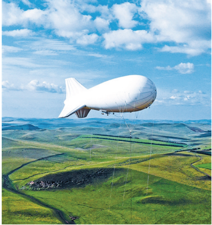
8月3日,内蒙古呼伦贝尔农垦特泥河农牧场上空升起系留气球。该气球由中国科学院研制,主要用于草畜资源状态监测,为草畜平衡提供支持。

五是强化法律责任。《条例》对违反本条例规定的行为设定了严格的法律责任,强化责任追究,特别是对建设单位及相关责任人的处罚力度。