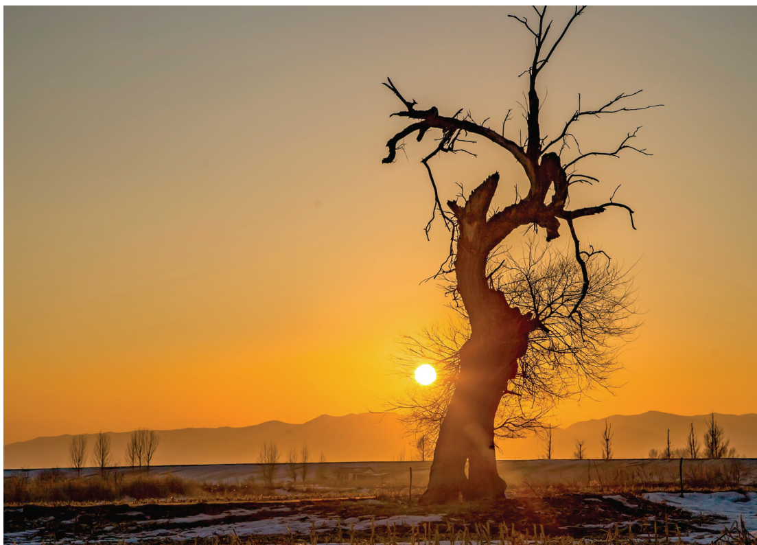
古树·夕阳