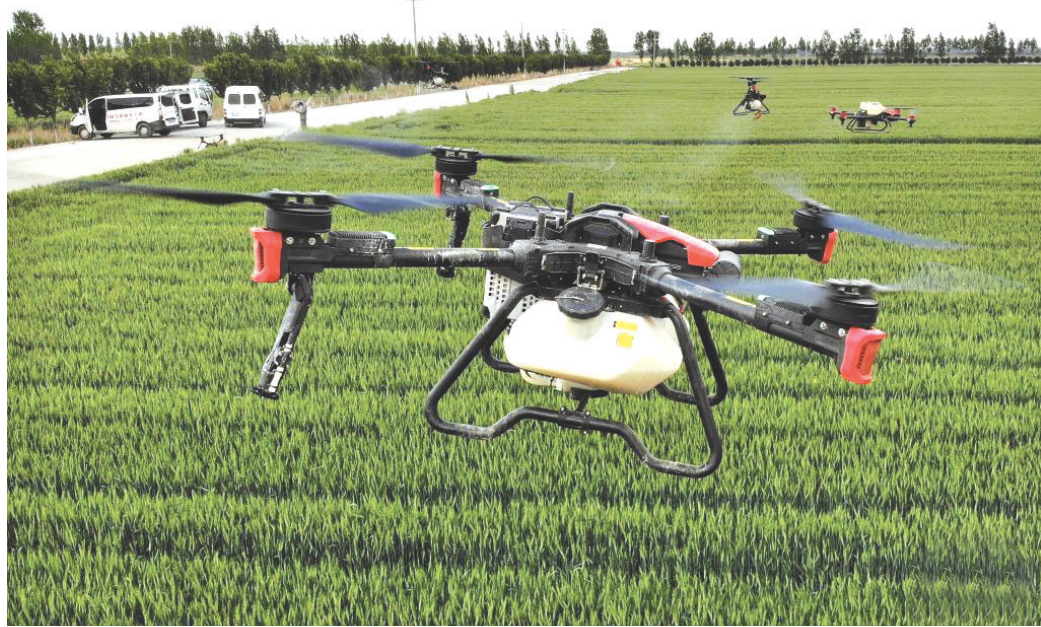
在青岛市平度田庄镇幸福庄村,植保无人机在进行“一喷三防”田间作业(无人机照片)。眼下正值山东小麦灌浆生长关键期,各地组织“飞防”专业技术人员,利用植保无人机对小麦开展“一喷三防”喷洒作业,为夏粮丰收提供支持和保障。

此外,山西支持利用闲置工业企业设施发展文化旅游业,实行文旅产业点状供地,支持利用未利用地、废弃土地发展文化旅游业。