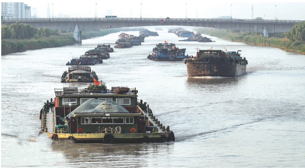
↑随着国内多地企业陆续进入全面生产,京杭大运河上运输木材、钢材、煤炭、石油、化工原料等各种原材料的货船往来穿梭,一派繁忙景象。

可以预期的是,未来养老金融业务将逐步形成多元主体参与、多类产品供给、满足多样化需求的发展格局。中国银保监会日前在《关于规范和促进商业养老金融业务发展的通知》中也明确提出,接下来,将支持和鼓励银行保险机构依法合规发展商业养老储蓄、商业养老理财、商业养老保险、商业养老金等养老金融业务。