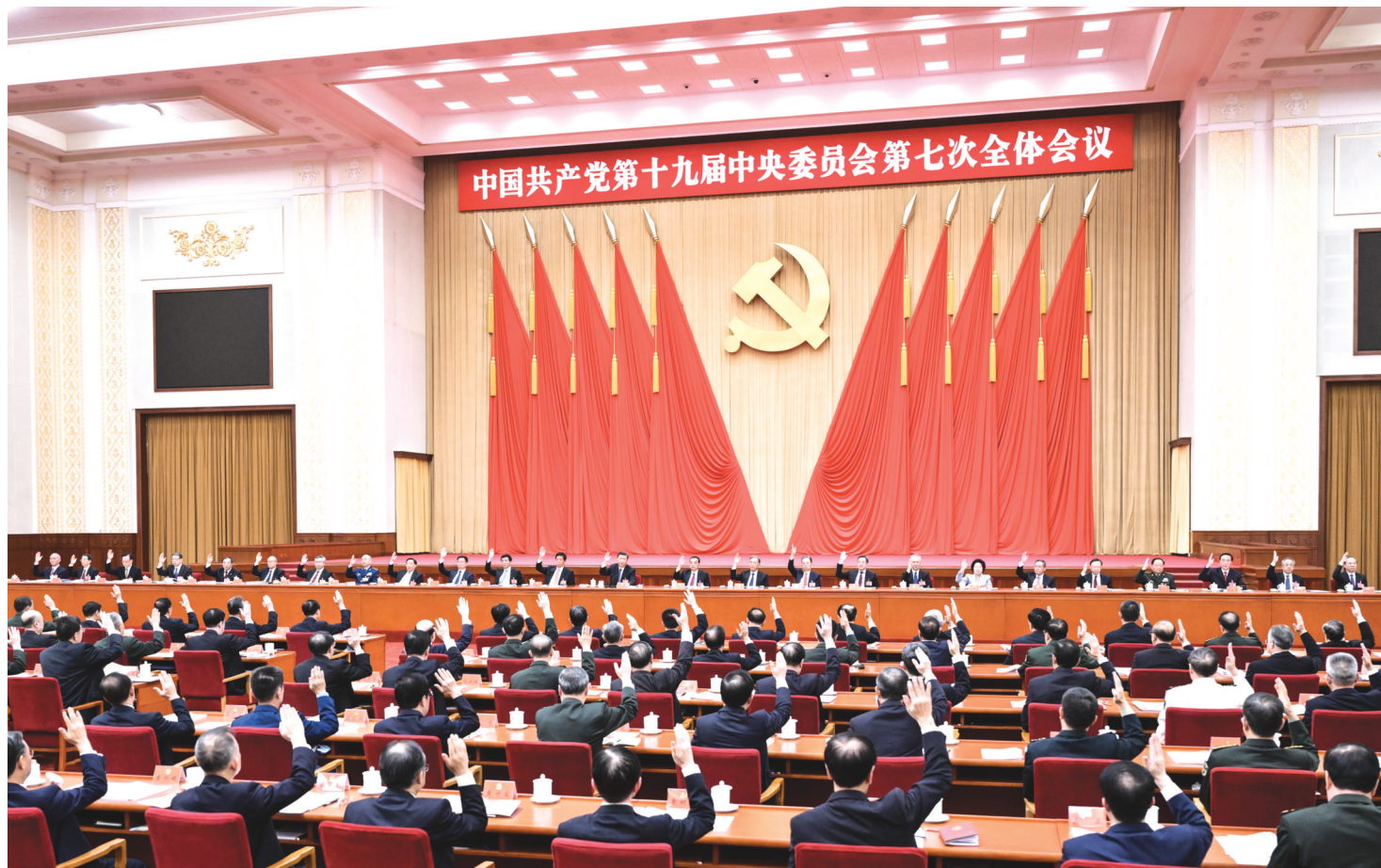
中国共产党第十九届中央委员会第七次全体会议,于2022年10月9日至12日在北京举行。中央政治局主持会议。