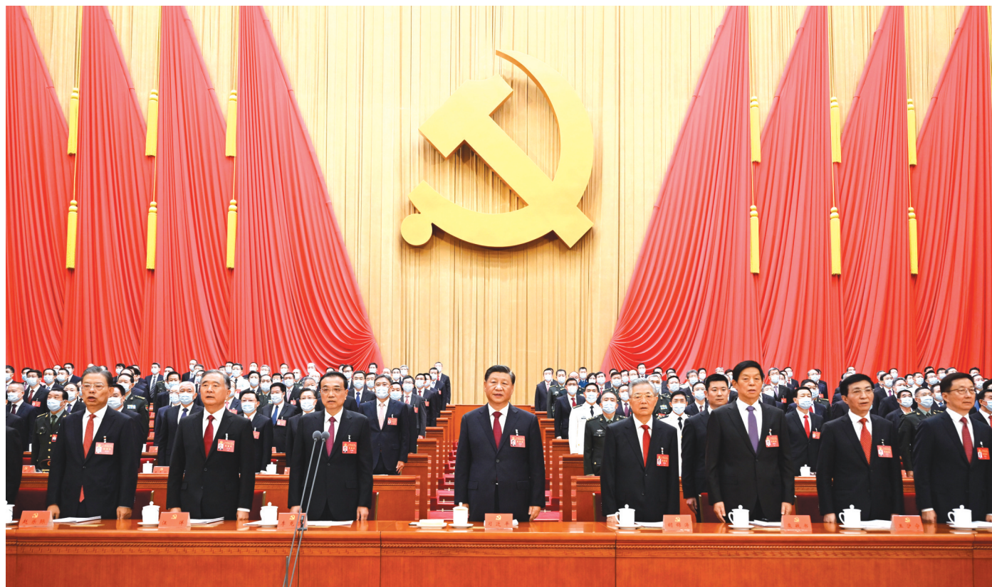
10月16日，中国共产党第二十次全国代表大会在北京人民大会堂开幕。习近平代表第十九届中央委员会向大会作报告。