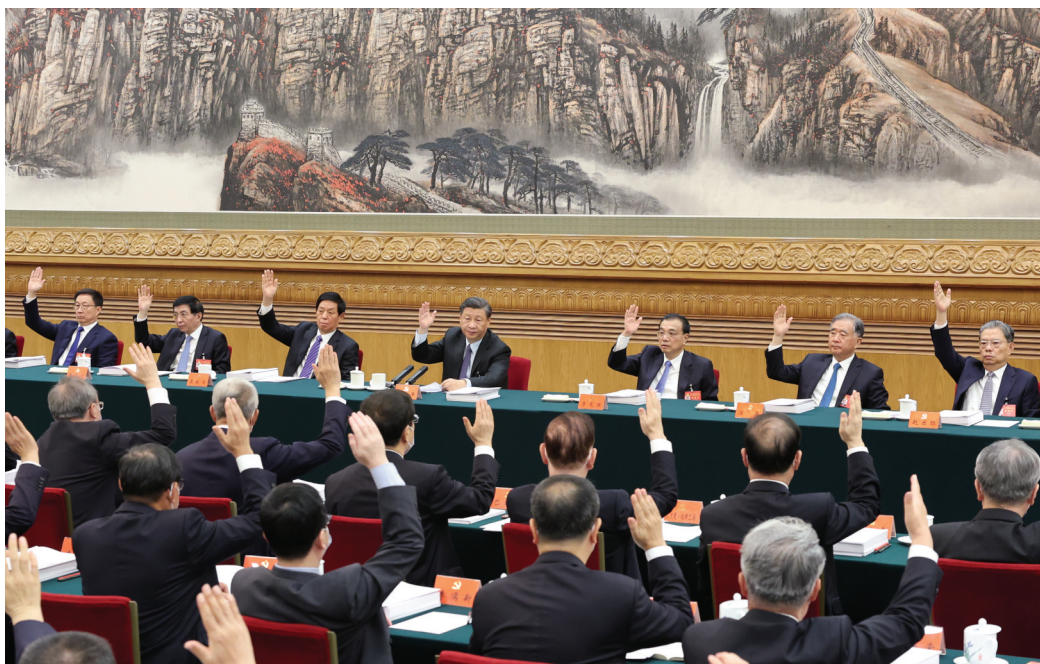
10月21日,中国共产党第二十次全国代表大会主席团在北京人民大会堂举行第三次会议。习近平、李克强、栗战书、汪洋、王沪宁、赵乐际、韩正等出席。

新华社北京10月21日电 中国共产党第二十次全国代表大会主席团21日上午在人民大会堂举行第三次会议,通过二十届中央委员会委员、候补委员和中央纪委委员候选人名单(草案),提交各代表团酝酿。