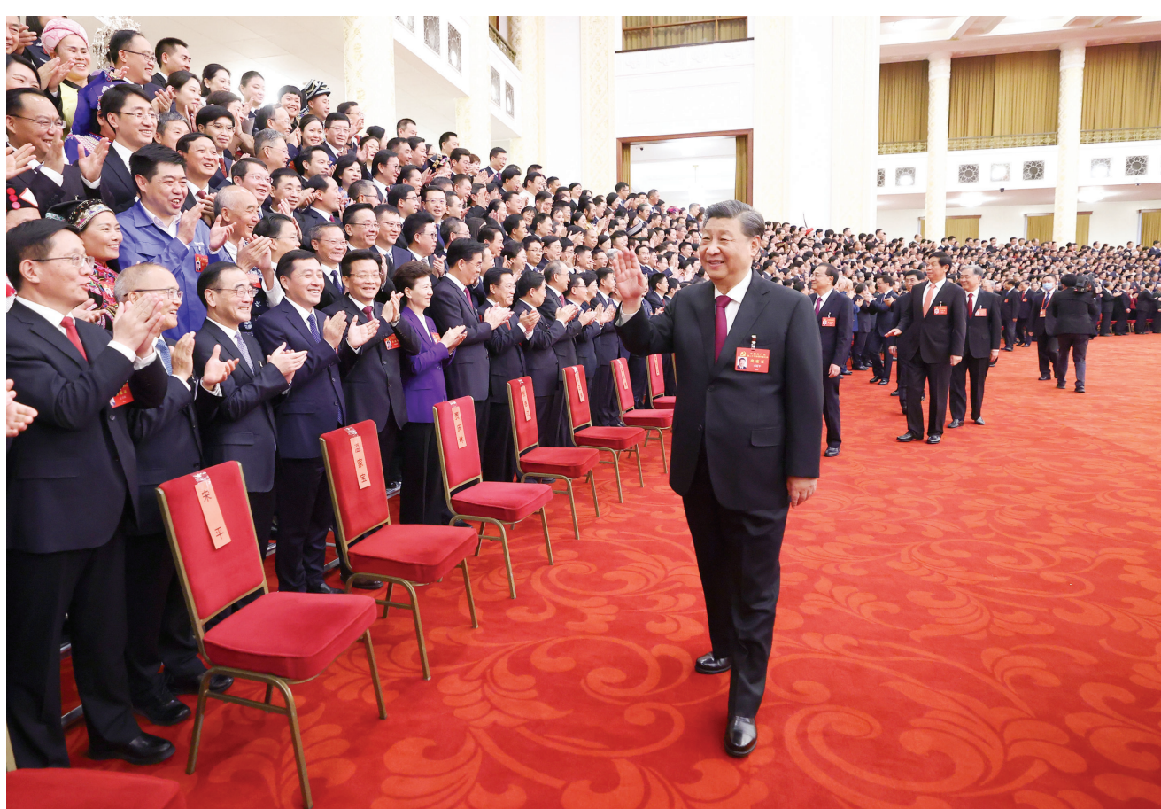
十月二十三日,下午,中共中央总书记、国家主席、中央军委主席习近平等领导同志在北京人民大会堂亲切会见出席党的二十大代表、特邀代表和列席人员,并同大家合影留念。