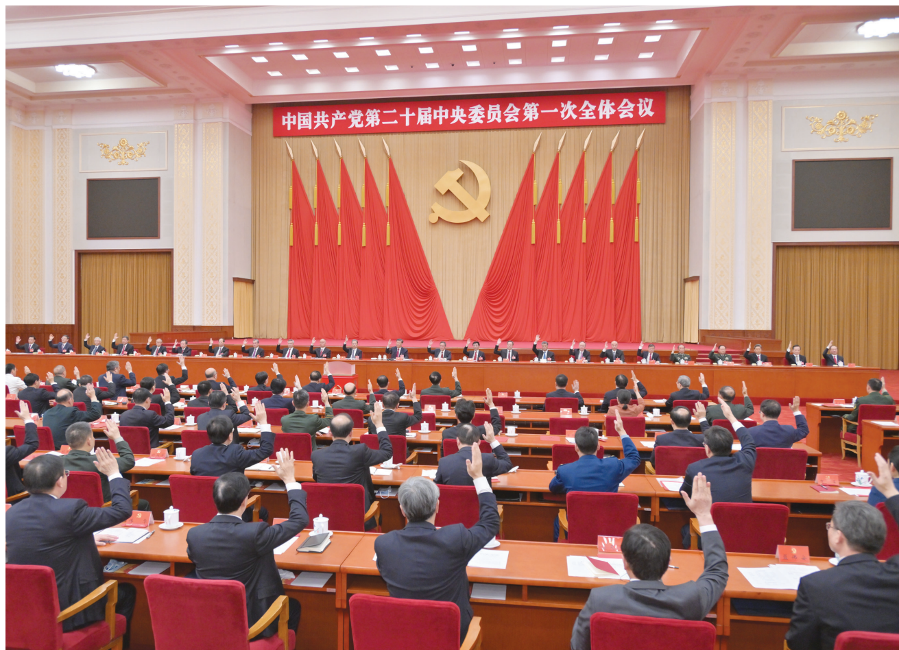
左图:10月23日,中国共产党第二十届中央委员会第一次全体会议在北京人民大会堂举行。习近平同志主持会议并在当选中共中央委员会总书记后作重要讲话。