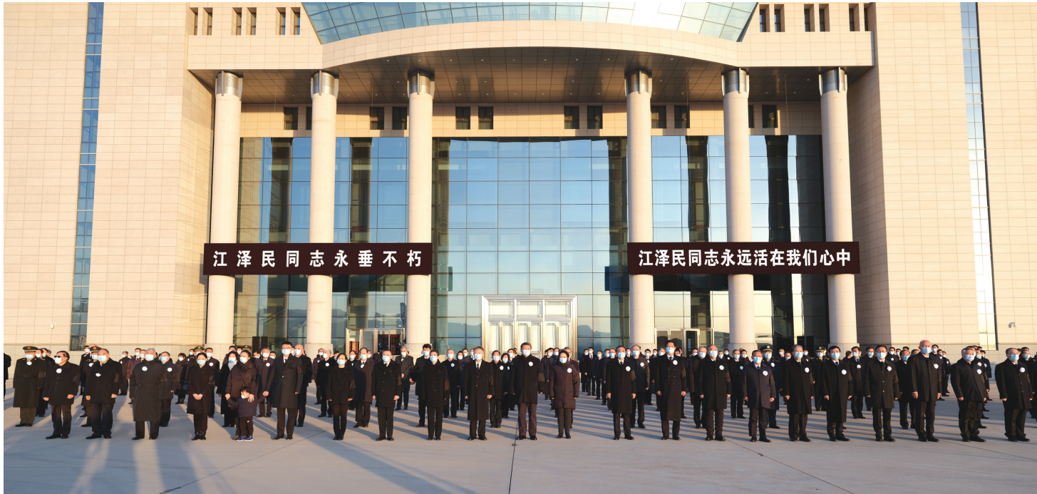
12月1日,江泽民同志的遗体从上海由专机敬移到达北京。习近平、李克强、栗战书、汪洋、李强、赵乐际、王沪宁、韩正、丁薛祥、李希、王岐山等党和国家领导同志到北京西郊机场迎灵。蔡奇等从上海护送江泽民同志遗体回到北京。