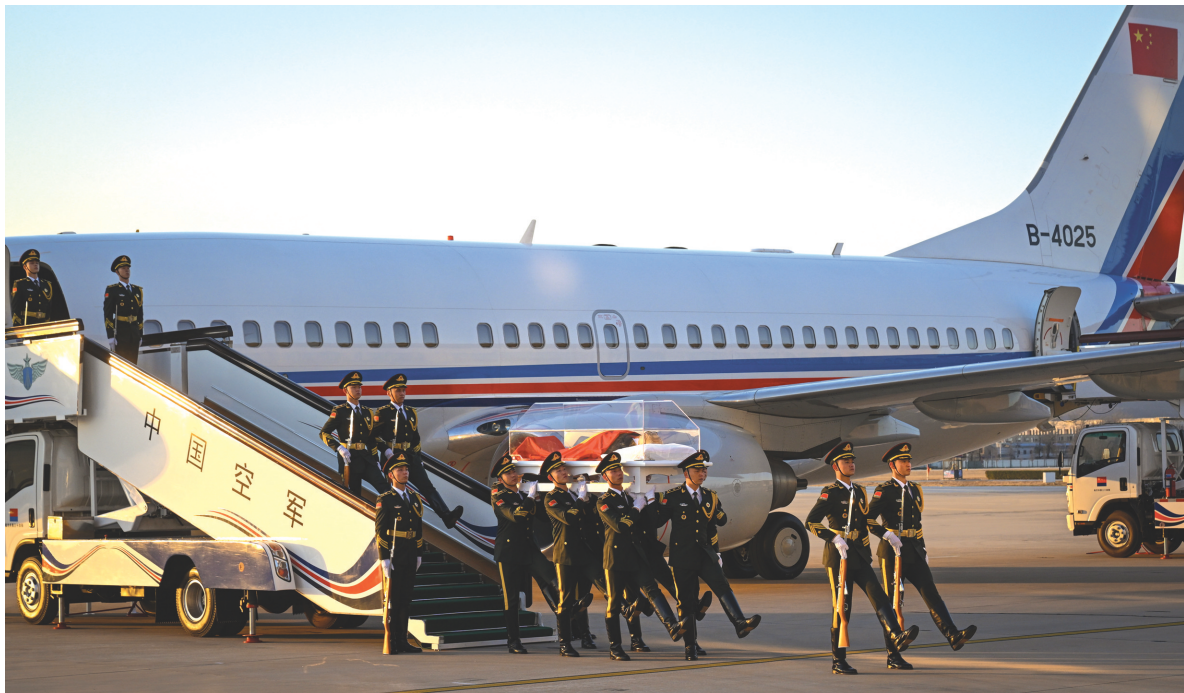
12月1日,江泽民同志的遗体从上海由专机敬移到达北京。