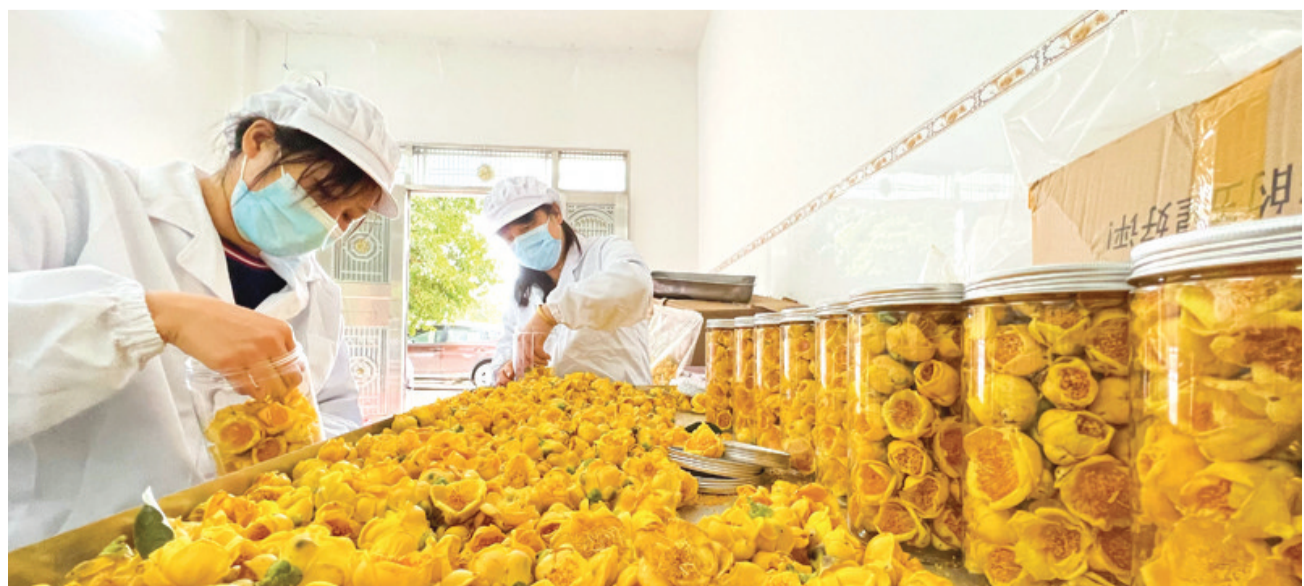
经过真空冷冻干燥的冻干花由工人进行包装。