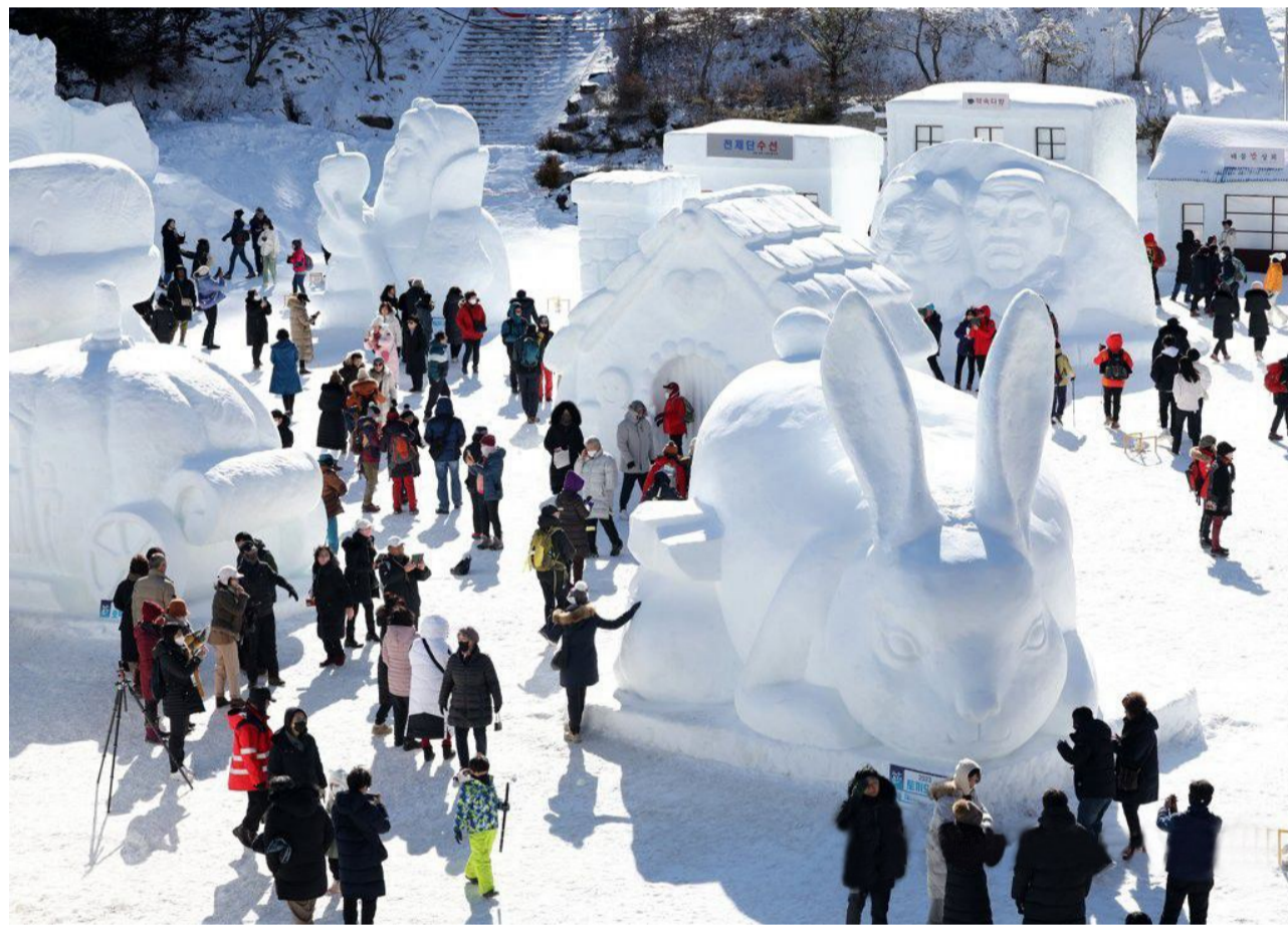
据韩联社报道,近日,第30届太白山冰雪节在江原道太白山国立公园内举行。造型美观、形态各异的雪雕作品吸引了不少游客驻足欣赏。(摘自人民网)

除钱币外,韩国考古人员还在寺庙遗址中,发掘出一尊“金铜多层小塔”。该塔用于安放舍利子,仅有成人拳头大小,上面绘有龙头、窗户、栏杆等结构保存完整。考古人员称,该塔可以用于复原高丽王朝时期的建筑,是重要发现。