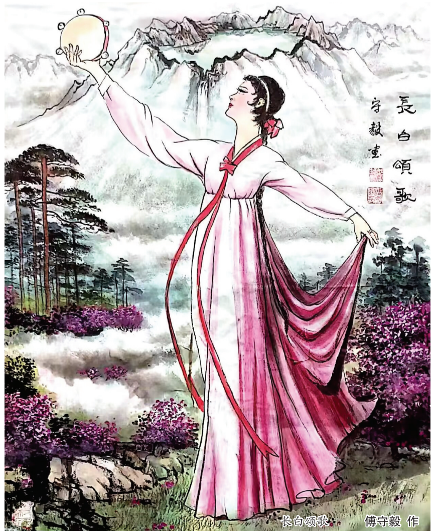
李白颂歌 傅守毅作

一年之计,莫如树谷;十年之计,莫如树木。在全球生态环境不断恶化的今天,绿水青山就是金山银山。在这个春天里,以实际行动厚植生态底色,就是在留住金山银山!