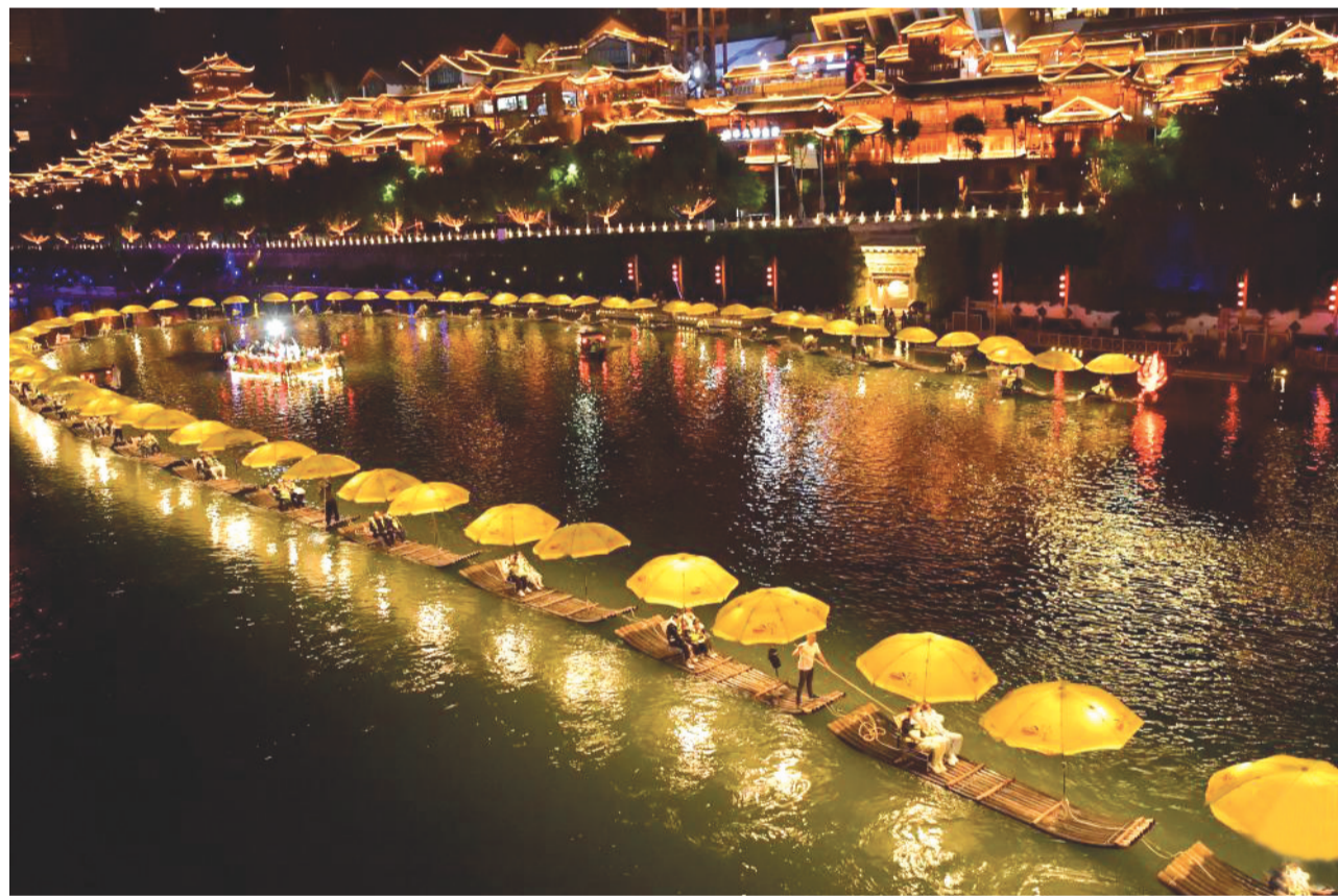
游客在湖北省宣恩县贡水河上乘坐竹筏欣赏夜色。“五一”假期,各地假日文旅市场活跃,“夜经济”为游客带来精彩体验。

“互联网+全民义务植树”活动的开展,实现了义务植树线上线下融合发展,汇聚起了更广大的爱绿植绿护绿力量,为筑牢我国北方重要生态安全屏障发挥着积极作用。