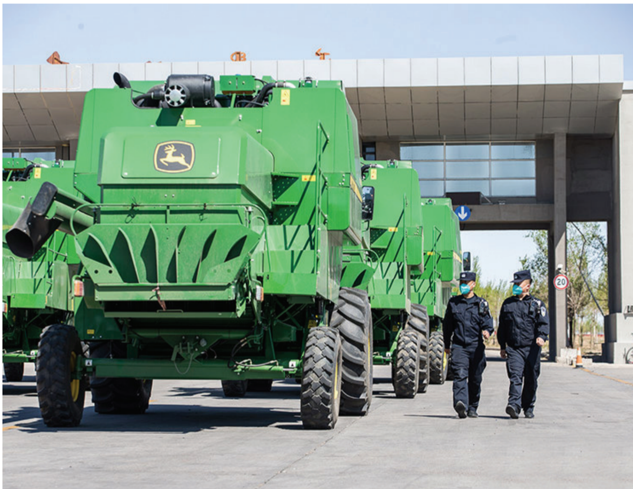
二连出入境边防检查站执勤民警对出口蒙古国的商品车进行车体检查。

6月14日，位于祖国北大门的内蒙古二连浩特公路货运口岸一片繁忙景象，收割机、装载机、拖拉机等商品车辆，从内蒙古出入境边防检查总站二连出入境边防检查站“商品车专用通道”快速通关。