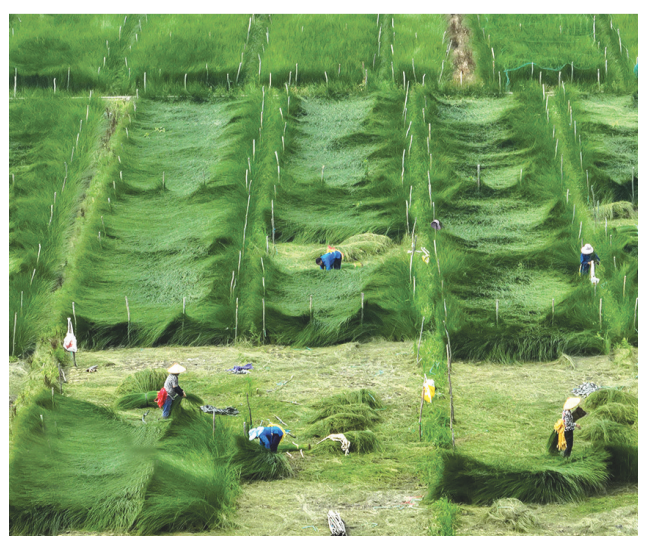
近日，浙江省宁波市海曙区古林、高桥、集士港等地近3万亩苜蓿迎来收割季，来自贵州、江西等地的“割草客”纷纷前来收割苜蓿，田间地头一派忙碌景象。

下一步，黑河市住房公积金管理中心将始终秉承“群众利益无小事，优质服务无止境”的服务理念，紧紧围绕“最多跑一次”的工作目标，进一步优化住房公积金“跨省通办”工作流程，对住建部和省厅部署要求的住房公积金“跨省通办”高频服务事项积极推进，为缴存人提供便捷高效的住房公积金事项“跨省通办”服务，让更多的缴存人享受到更加高效便民的住房公积金服务。