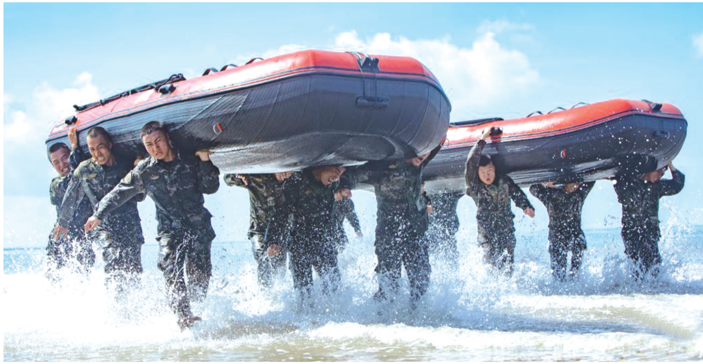
武警广西总队防城港支队官兵组织扛舟行进训练(7月31日摄)。军旗飘扬,军徽闪耀,军歌嘹亮。连日来,全军官兵以军人特有的方式庆祝中国人民解放军建军96周年。

《通知》明确了优化授信服务策略、完善融资增信策略等一系列举措。在优化上市培育策略方面,《通知》提出各地工业和信息化主管部门结合优质中小企业梯度培育工作,摸排链上中小微企业上市意愿、经营情况等,建立上市企业后备库。