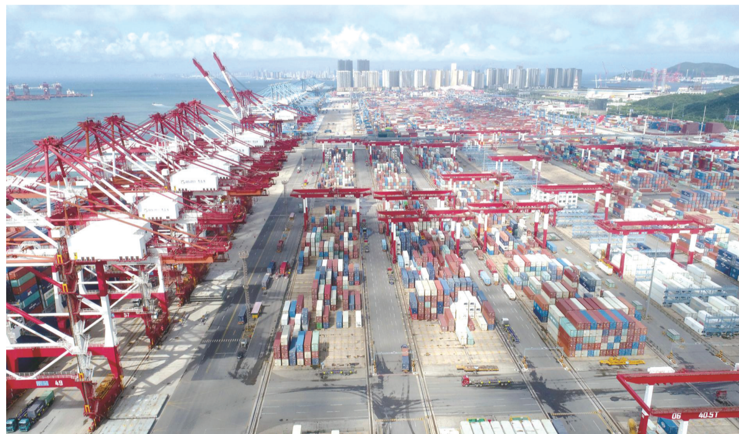
近日,在山东港口青岛港前湾联合集装箱码头,数十艘货轮在装卸货物,港口一派繁忙景象。今年上半年,山东港口完成货物吞吐量同比增长7.7%,集装箱量同比增长11.4%,继续保持向好态势。

各地也在积极推动跨境电商高质量发展。近日,上海出台《上海市推进跨境电商高质量发展行动方案(2023—2025年)》,提出持续推进跨境电商示范园区建设、实施“出海优品”行动计划、提升跨境电商公共服务能级等18项重点工作任务。山东提出,力争到2025年,全省打造20个跨境电商特色产业带,培育100个具有较强国际竞争力的跨境电商知名品牌,孵化1000家跨境电商新锐企业。