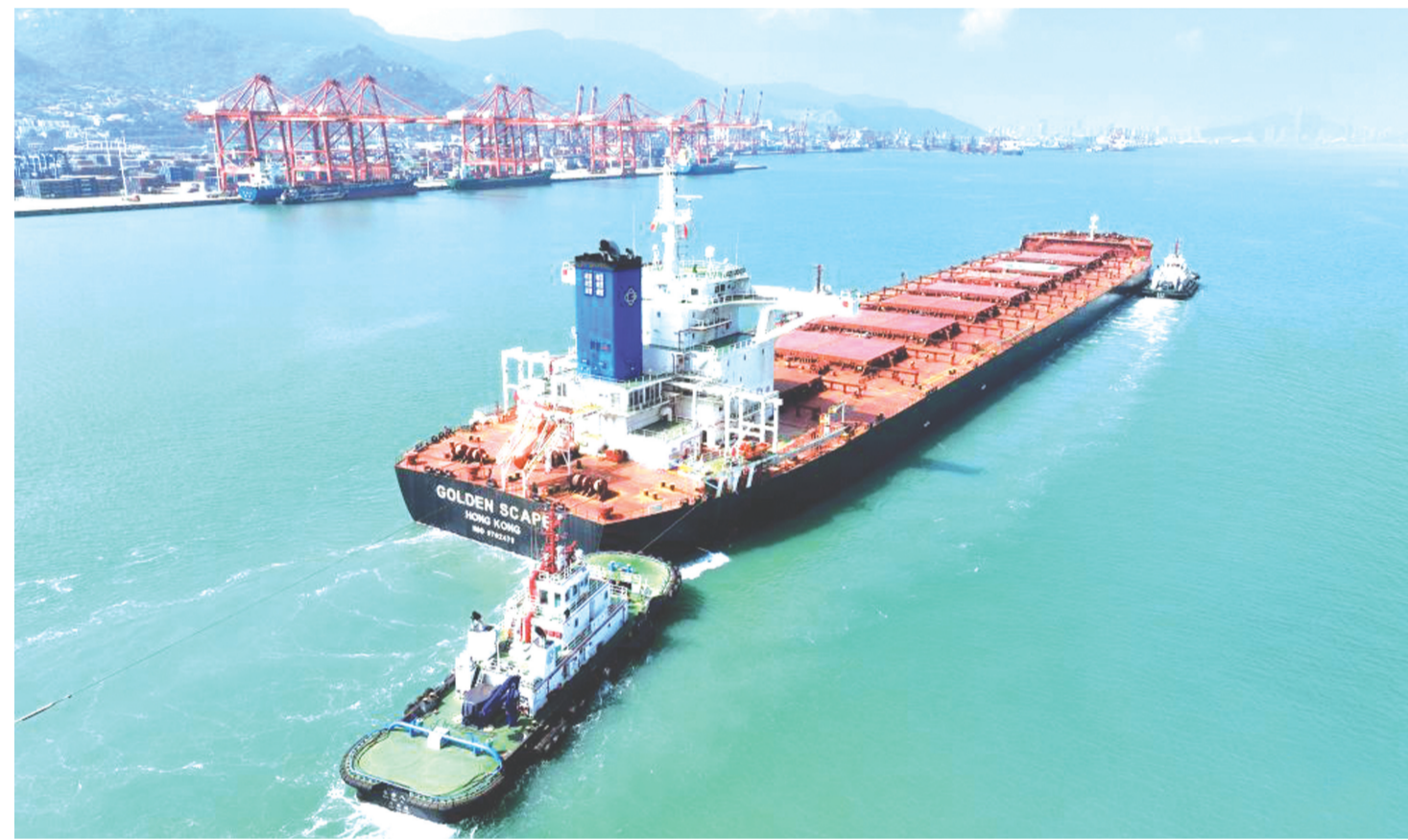
9月7日,在江苏连云港港集装箱码头,一艘货轮准备停靠泊位卸载货物(无人机照片)。海关总署9月7日发布数据显示,2023年前8个月,我国货物贸易进出口总值27.08万亿元。尽管同比微降0.1%,但规模仍处历史同期高位。其中,8月当月进出口3.59万亿元,同比下降2.5%,环比增长3.9%。

据了解,下一步,安徽自贸试验区将围绕服务国家战略,锚定“三地一区”战略定位,聚力建设“七个强省”,以高标准高质量推进自贸试验区建设,加快打造改革开放综合试验平台,更好发挥引领安徽省高质量发展的“试验田”作用。