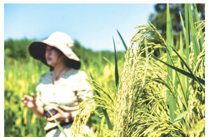
9月7日,当地工作人员在向游客介绍水稻种植情况。时下,位于重庆市大足区拾万镇长虹村的隆平五彩田园迎来秋收季,300亩彩色水稻勾勒出金秋好“丰”景。

意见强调,鼓励有条件的地区通过多种方式支持社会救助领域慈善组织的启动成立和初期运行,按规定落实税收优惠、费用减免和政府购买服务相关政策措施。通过中华慈善奖评选表彰、社会救助先进集体和先进个人评选等方式,对贡献突出的慈善组织和慈善项目给予激励褒扬,并在等级评估等方面给予适当倾斜支持。