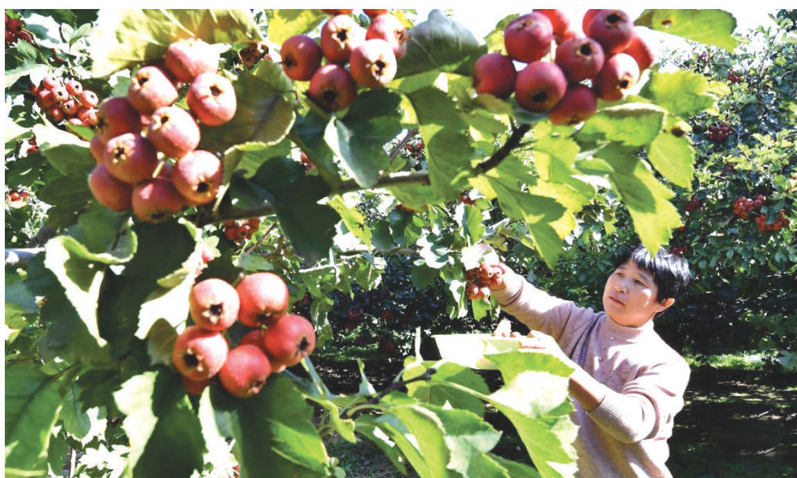
10月9日,河北省晋州市马于镇西贾庄村的农民在果园采摘山楂。金秋时节,河北省晋州市的1.2万亩山楂进入成熟期,当地果农抢抓农时适时采收,供应市场。近年来,晋州市引导农民因地制宜发展山楂产业,并推动标准化管理、规模化种植,山楂产业已成为带动当地群众增收的特色产业。

接下来,省教育厅还将会同省体育局组织吉林省青少年冰雪冬令营活动,广泛开展冰雪运动或替代项目竞赛活动,充分发挥示范、引领、带动作用,有效培养全省中小学生冰雪运动乐趣。