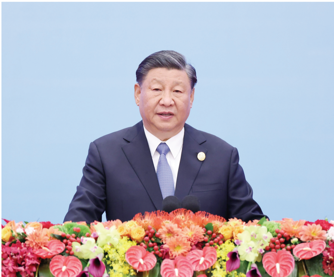
10月18日上午,国家主席习近平在北京人民大会堂出席第三届“一带一路”国际合作高峰论坛开幕式并发表题为《建设开放包容、互联互通、共同发展的世界》的主旨演讲。