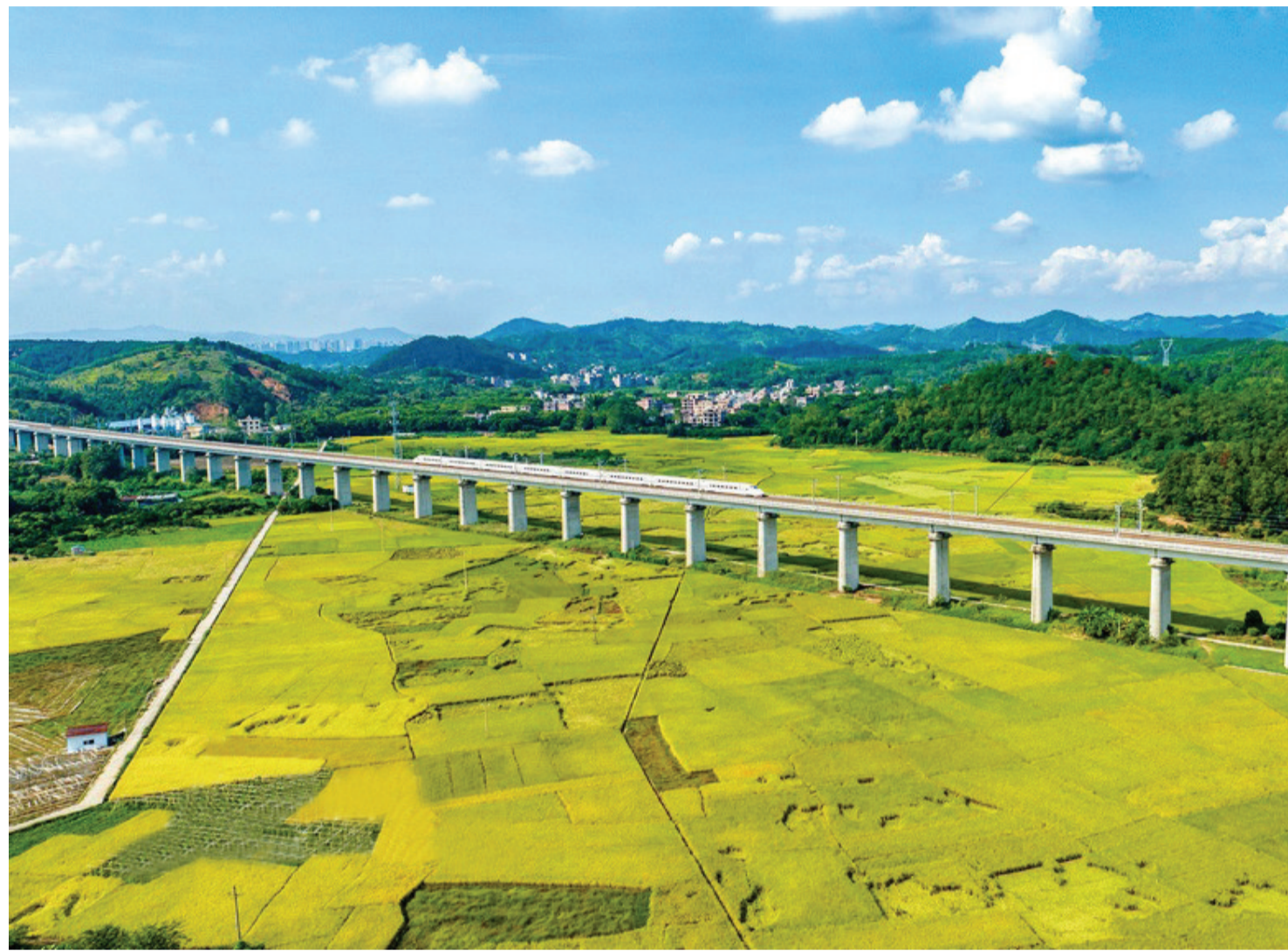
10月25日,广西梧州市龙圩区大坡镇河步村,万亩金黄的稻田与过境的广昆高铁,构成一幅美丽乡村画卷。

据悉,余姚市委加强对廉洁文化教育基地的统筹谋划和顶层设计,2023年年初开展了首批廉洁文化教育基地的评审工作,命名了13个市级廉洁文化教育基地。同时坚持优胜者进、劣者汰的动态管理机制,推进基地建设迭代升级与良性发展。