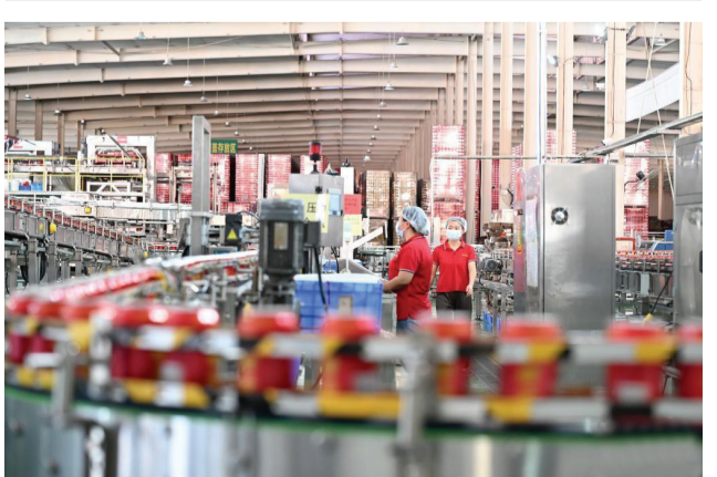
10月24日,工人在贵州王老吉刺梨吉惠水基地饮料灌装车间内工作。刺梨是一种贵州本地特色水果,近年来,贵州省惠水县依托“广东企业+贵州资源”合作模式,助力贵州刺梨产业、物流、包装、罐装等十余家生态链企业发展。截至2022年底,贵州刺梨种植面积达210万亩,带动20余万群众增收致富。

曾经,古丝绸之路的驼队见证了东西方文明的交流。如今,横跨亚欧大陆的“钢铁驼队”正在开创中国与亚欧各国国际运输的新格局。期待“班列之城”满洲里的新征程越来越璀璨。