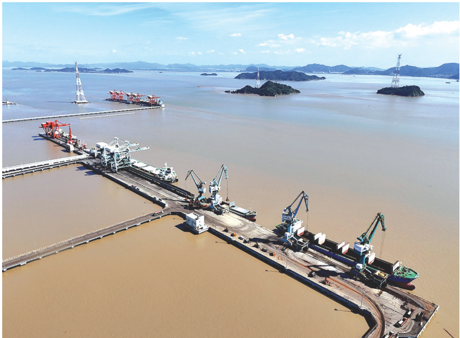
10月29日,浙江省温州市乐清湾港区泊位靠满了前来作业的货轮,桥吊作业紧张有序,自动化管输持续作业,接驳货车往来穿梭,码头生产一派繁忙景象。近年来,浙江省温州市乐清湾港区持续完善港区基础设施,提升港口开放能力、聚力临港产业培育,通过“水铁联运”、港口仓储、物流服务等业务,增强港口集聚和辐射功能,实现港口货物吞吐稳步增长。

戴宏浩所做的工作,是台州3000多名就业协理员的常态。聚焦基层公共就业服务提质增效,台州全力打通市域“15分钟就业服务圈”,目前已实现全市131个乡镇(街道)、3305个村(社区)公共就业服务全覆盖。