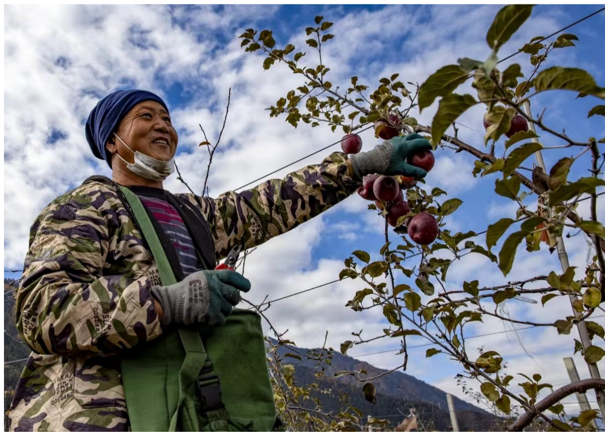
米林市羌纳乡西藏林芝现代苹果标准化园区内,农民在采摘苹果(11月13日摄)。时值初冬,西藏米林市羌纳乡西藏林芝现代苹果标准化园区内的高原晚熟苹果喜获丰收。据了解,这个产业园面积达到1800亩,平均亩产5000多斤优质苹果,产品远销到全国10多个省份。

当日,西藏各地市人民政府(行署)有关负责同志与引进企业代表,区内有关用人单位负责同志与专家人才代表分别签约。西藏自治区党委组织部相关负责人表示,西藏自治区将进一步营造尊商亲商、聚商活商和引才聚才、尊才爱才的良好环境,全力支持广大企业家投资兴业,支持人才干事创业。