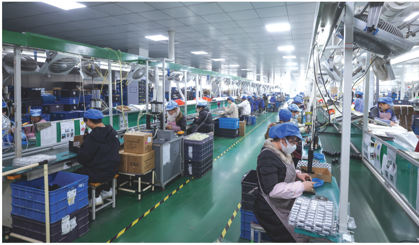
12月27日，在位于慈溪市周巷镇的月立集团有限公司装配车间内，工人们生产电吹风。该公司是一家专业生产电吹风、美发器、剃须刀、电熨斗等个人护理电器产品的制造商，是全球最大的电吹风制造商工厂之一，电吹风年产量超1100万台，在行业内名列前茅。浙江省慈溪市是我国三大家电产业基地之一，产业链完善，是国内外小家电采购的重要基地。今年前三季度，慈溪市规上智能家电产业产值636.6亿元，同比增长5.8%，增长势头明显。