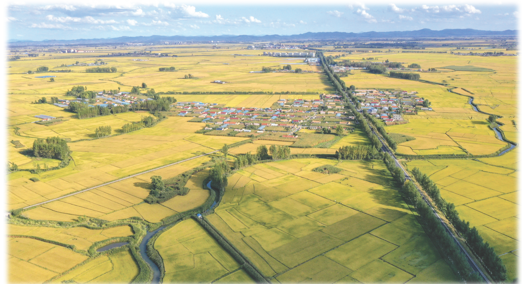
吉林省吉林市永吉县万昌镇位于“世界黄金水稻带”,2023年水稻种植面积12.5万亩,是吉林省水稻重要产区之一。

全省新登记经营主体61.9万户,增长14%,总量达到359万户,增长8.2%,每千人拥有经营主体152户,居全国前列;全省