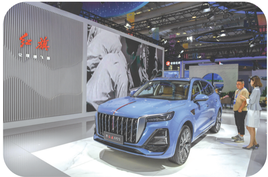
2023年8月23日,在第十四届中国—东北亚博览会现场,参观者参观一汽红旗展出的汽车。

2023年11月28日,中共吉林省委十二届四次全会召开,审议通过《中共吉林省委关于深入贯彻落实习近平总书记在新时期推动东北全面振兴座谈会上的重要讲话精神 推动吉林全面振兴率先实现新突破的决定》。