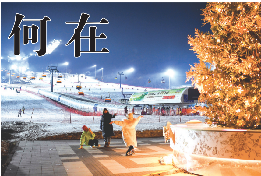
吉林省在“冰天雪地也是金山银山”理念下探索冰雪旅游、冰雪体育、冰雪文化、冰雪经贸等领域的全链拓展。冰雪经济正成为农民冬季致富新路径,吉林乡村振兴新引擎。图为游客在吉林省吉林市万科松花湖度假区拍照留念。

全省新登记经营主体61.9万户,增长14%,总量达到359万户,增长8.2%,每千人拥有经营主体152户,居全国前列;全省