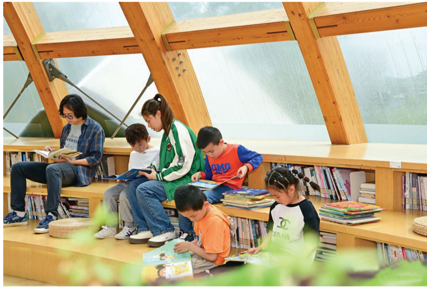
近日,在江西省南昌市南昌县莲花书屋,许多阅读爱好者前来借阅书籍。“五一”假期,不少群众选择到书屋、书店、书城阅读学习“充电”,度过一个书香假期。