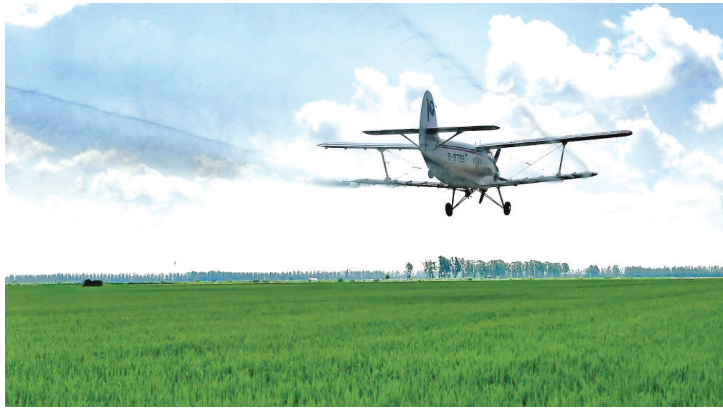
7月10日,在北大荒集团八五六农场有限公司一块水稻田上空,农用飞机在进行航化作业。近日,黑龙江垦区北大荒集团各农业生产单位陆续开展农田航化作业,通过防病、追肥、灭虫统防统治,保障作物健康生长。

黑河市坚持山水林田湖草沙生命共同体理念,统筹布局农业空间、生态空间、城镇空间,全面启动国土空间生态综合整治,有序推动历史遗留废弃矿“山”生态修复。制发2024年造林绿化实施方案,申请资金1227.5万元,实施小兴安岭森林湿地保护修复综合治理项目。启动国土空间生态修复规划编制,强化生态系统碳汇基础支撑,重点开展森林、草原、湿地调查监测。突出开发碳汇造林项目,探索将碳汇资源转化为可交易的碳票,最终形成经济效益。制定黑河市生态产品目录清单,建立动态自然生态资源转化项目库,已入库项目28个,总投资27.6亿元。