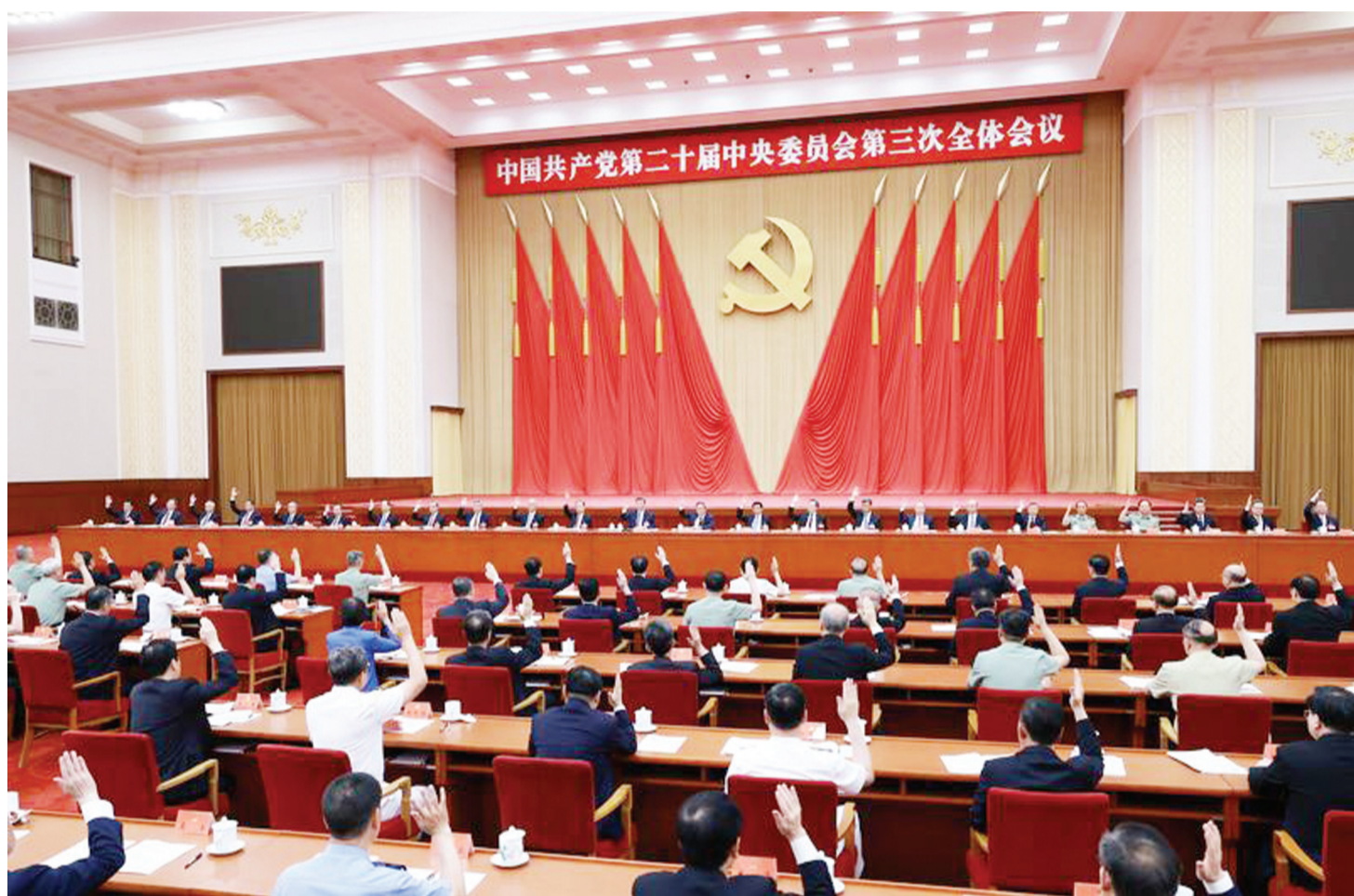
中国共产党第二十届中央委员会第三次全体会议，于2024年7月15日至18日在北京举行。中央政治局主持会议。新华社记者 王晔 摄