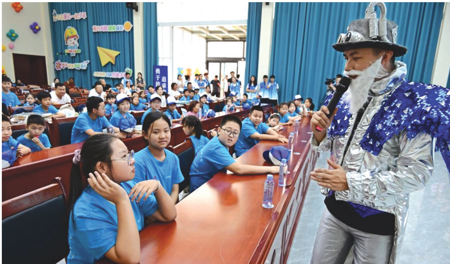
7月25日,一名女孩(左前)在科学课上回答“科学博士”提出的问题。当日,在山东省青岛市中铁建工一项目部,2024年青岛市建筑工地“小候鸟”驿站志愿服务活动启动。暑假期间,来自山西、黑龙江、四川等地的230余名儿童,与坚守在岛城各处建筑工地务工的父母团聚。工地驿站志愿者们将通过开展研学参观、科学课堂、作业辅导、拓展训练等活动,让孩子们度过一个快乐、有意义的多彩假期。

据新华社电(记者 谢希瑶)商务部等七部门近日联合印发的《关于服务高水平对外开放便利境外人员住宿若干措施的通知》25日对外发布。通知围绕依法合规经营、提升接待能力、加强行业自律、发挥平台作用、优化登记管理、畅通服务渠道、提升支付便利度、营造友好氛围八个方面,推动进一步便利境外人员在境内住宿。通知要求,地方相关部门、网络运营平台不应以资质要求等为由限制住宿业经营者接待境外人员住宿,网络运营平台、住宿业经营者不应违规对外发布不接待境外人员住宿的有关信息;支持住宿业经营者开展培训提升服务能力,强化行业自律,确保经营行为符合法律法规和消费者权益保护规范;压实网络运营平台责任,加强对入驻商家发布信息审核把关;进一步优化住宿业经营者对境外人员住宿登记的管理服务工作,简化信息采集项目,坚持教育管理先行,包容审慎执法;完善境外人员沟通服务渠道,持续推动提升住宿领域支付便利度,营造良好涉外服务环境。