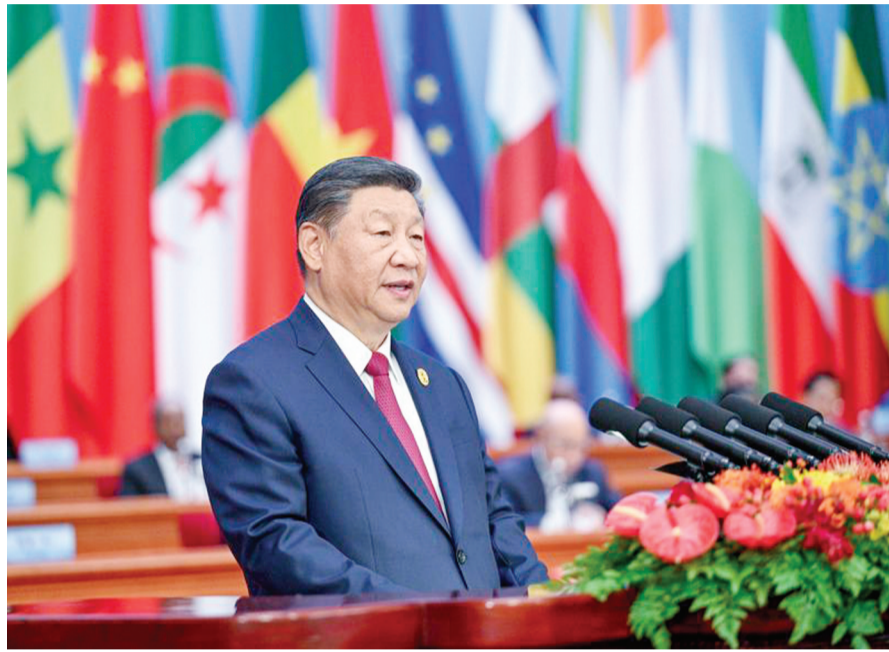
9月5日上午,国家主席习近平在北京人民大会堂出席中非合作论坛北京峰会开幕式并发表题为《携手推进现代化,共筑命运共同体》的主旨讲话。