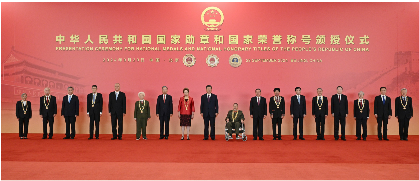
9月29日,中华人民共和国国家勋章和国家荣誉称号颁授仪式在北京人民大会堂金色大厅隆重举行。习近平等领导同志同国家勋章和国家荣誉称号获得者合影留念。

新华社北京9月29日电 中华人民共和国国家勋章和国家荣誉称号颁授仪式29日上午在北京人民大会堂金色大厅隆重举行。中共中央总书记、国家主席、中央军委主席习近平向国家勋章和国家荣誉称号获得者颁授勋章奖章并发表重要讲话。习近平强调,伟大时代呼唤英雄、造就英雄。英雄辈出,党和人民事业就会兴旺发达、长盛不衰。各级党委和政府要关心关爱英雄模范,推动全社会尊崇英雄、学习英雄、争做英雄。希望受到表彰的同志珍惜荣誉、再接再厉,争取更大荣光。